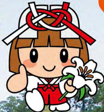
多賀町マスコットキャラクター たがゆいちゃん